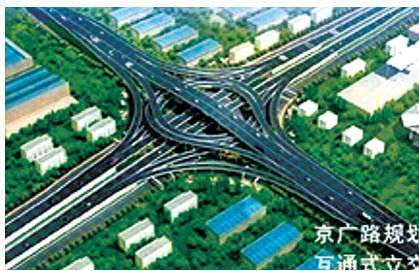
京广路规划二期效果图

为加快我市“环形+井字”快速通道和次干道、支线路网建设,形成功能完善、运行高效的快速路网结构,2014年市政府工作报告关于“畅通郑州”工程的计划中明确提出,今年我市将开建3条快速路。三大快速路工程包括金水路准快速化工程、花园路—紫荆山路准快速化工程及农业路快速路工程。金水路准快速化工程包括经三路—城东路下穿隧道工程、东明路下穿人行通道和未来路下穿隧道工程。项目总投资约10.9亿元,计划工期18个月,春节后进场施工。花园路—紫荆山路准快速化工程主要包括连续下穿黄河路—紫荆山立交—东西大街长隧道工程和东风路下穿花园路隧道工程,均为双向四车道城市准快速路。项目总投资约18.8亿元,预计2014年下半年开工建设。农业路快速路工程,西起西三环,东至中州大道,全长约10.8公里。按照规划,南阳路以东到中州大道为下穿隧道,南阳路以西到西三环为高架桥,设计双向六车道,工程投资概算50亿元,预计2014年下半年进场施工。