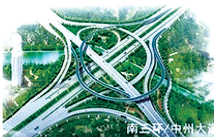
南三环中州大道高架效果图

2013年12月底,地铁1号线和三环快速路主体高架的部分开通,不仅改变了市民的出行方式,同时也缓解了郑州市交通拥堵的现状。2014年,我市将加快“畅通郑州”各项工程建设,力争陇海路高架大学路以西段、京广快速化二期主体完工,开工建设金水路、花园路快速和农业路快速路明确写入政府工作报告中,成为今年“畅通郑州”工作的主要内容。同时,作为“高效便捷”的快速交通体系、“井字+环形”快速路系统的关键组成部分,三环快速化将随着中州大道互通立交及南北延工程的全面竣工,在今年上半年全线通车。 郑州报业集团全媒体记者 吴淑娟