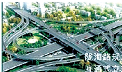
陇海路高架规划效果图

三环快速化北三环、西三环、南三环工程高架桥主线已于2013年12月底通车,由于中州大道互通式立交、中州大道南北延开工时间稍晚,而北三环(中州大道—花园路段)受北三环中州大道互通立交桥施工影响(该段内无下桥匝道),计划到今年5月份全线贯通。“中州大道互通立交主体工程