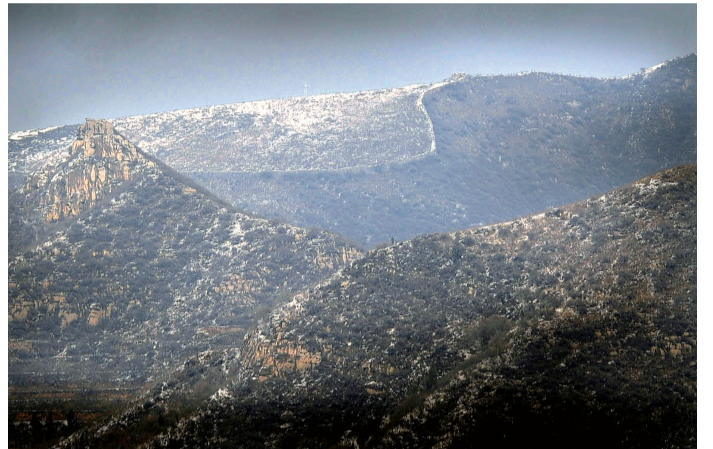
虽没有八达岭长城连绵起伏的气势,但有高居山巅的醒目。

魏长城有两道:一是西北的防秦和防戎长城(河西长城),二是南长城(河南长城)。河西长城是魏惠王在位时,利用西部边境上洛水的堤防扩大而修筑的,南起今陕西华县山北麓的相元洞,达内蒙古的固阳。魏惠王晚年,修筑了保护国都大梁(开封)的南长城,经今河南原阳县境转向东南,向西直达新密市。