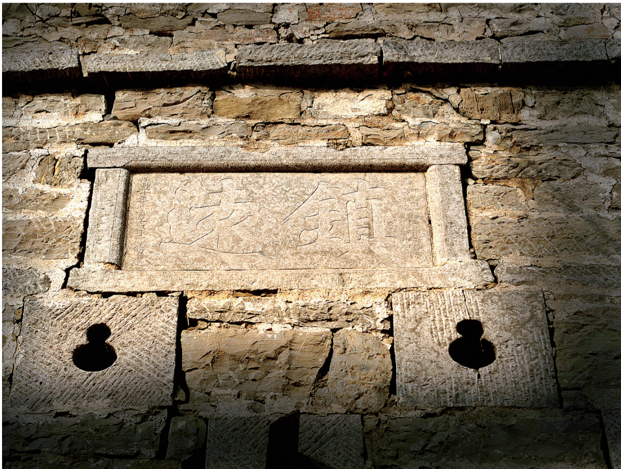
镇远炮台建造于清代咸丰年间。

1987年3月4日,郑州市人民政府公布其为市文物保护单位。2013年7月28日,新密魏长城成为第六批省级文物保护单位。保护整修新密魏长城不仅对开发当地的旅游资源有着重要的作用,也是研究古代建筑学与战争防御学极其重要的历史佐证,随着岁月流逝,该长城风蚀雨淋,面目凄惨,令人惋惜。不过,记者从新密市文物管理处获悉,郑州市已拨专项资金,对魏长城进行保护和维修,这个已有2000多年历史的文物遗迹将焕发出新的光彩。