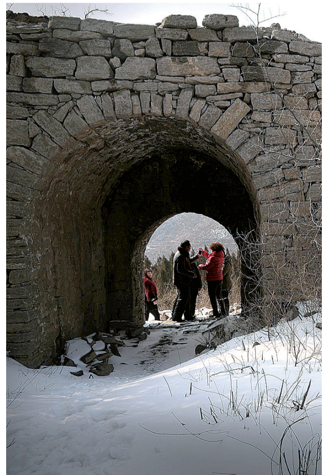
魏长城逐渐被外界所知,每日前来游玩的市民逐渐增多。