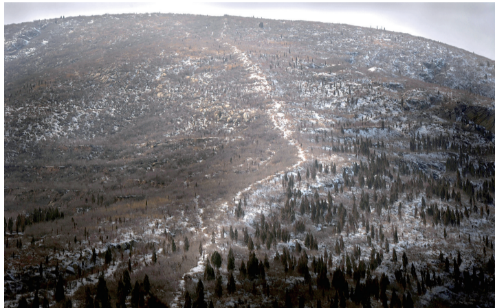
经过2000多年的风雨侵袭,废弃的魏长城在山脊上依然清晰可见。