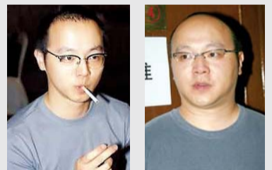
其实窦唯近年已经在朝着发福大叔的路上狂奔。看看同样的灰色T，2008年的图（右）和年轻时（左）的对比……