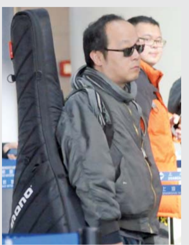
近日，窦唯现身上海机场的照片……不忍多看，我们还是往下看他清朗的模样吧——像蔚蓝清澈的天空。