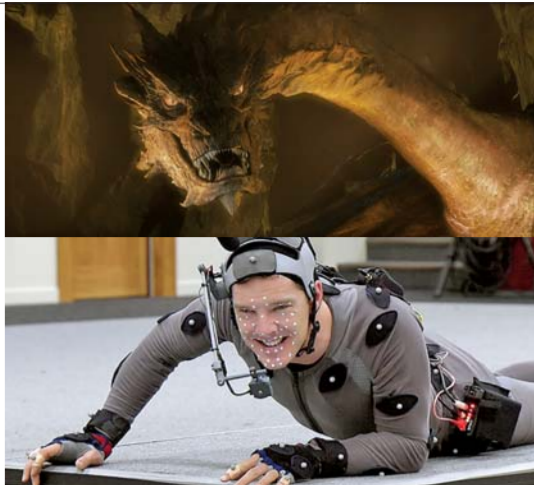
由康伯巴奇饰演的巨龙真的说了很多话。