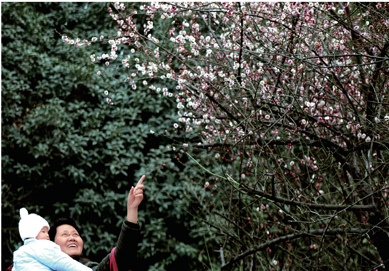
碧沙岗公园红梅已盛开,花期将持续半个月左右,喜欢梅花的朋友,有空了去赏梅吧!