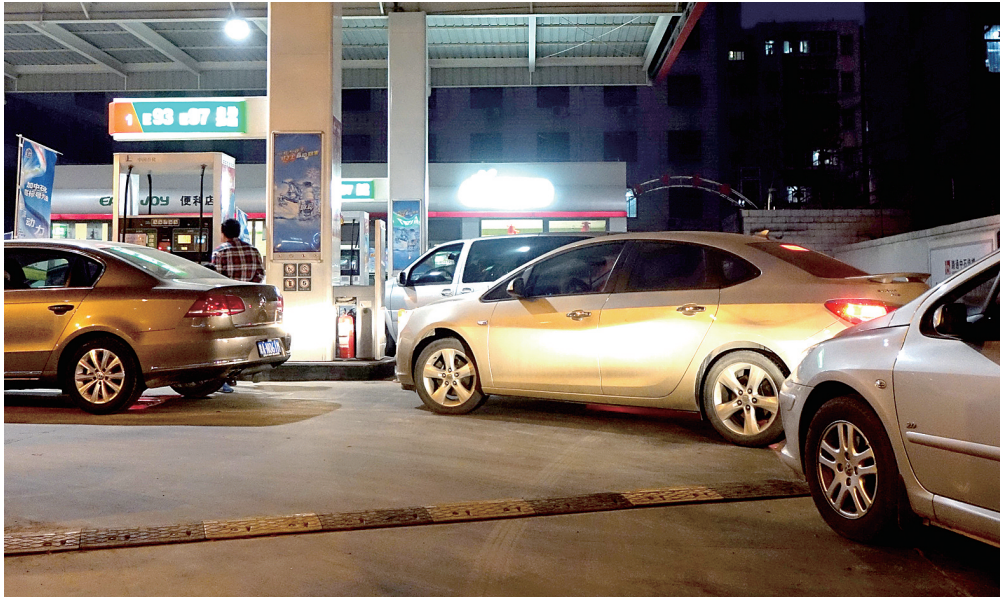
昨天晚上,淮河路一加油站,司机排队等候赶在油价上涨前加油。

昨日,国家发改委发出通知,决定将汽、柴油价格每吨分别提高205元和200元,测算到零售价格90号汽油和0号柴油(全国平均)每升分别提高0.15元和0.17元,调价执行时间为2月26日24时。据了解,从今天起,我省93号汽油一升上调0.16元,0号柴油一升上调0.18元。这也是今年首次上调油价。 郑州晚报记者 徐刚领/文