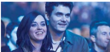
2012年12月一起看滚石演唱会。