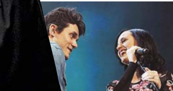
合作《Who You Love》。