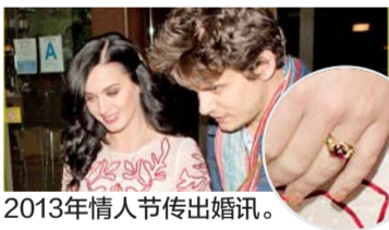
2013年情人节传出婚讯。