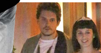
2014年情人节又传婚讯。

从2012年开始,佩里和梅耶上演过N场分分合合的戏码,他们在2012年夏天公开恋情,有过简短的分手之后复合,去年3月再度分手,之后又再度复合。