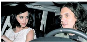
2012年8月恋情曝光,不久传分手。