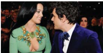
2013年情侣装出席格莱美颁奖礼。