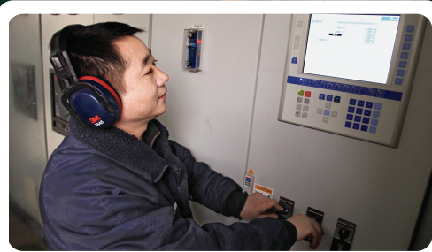
工作人员启动发电装置正式开始发电