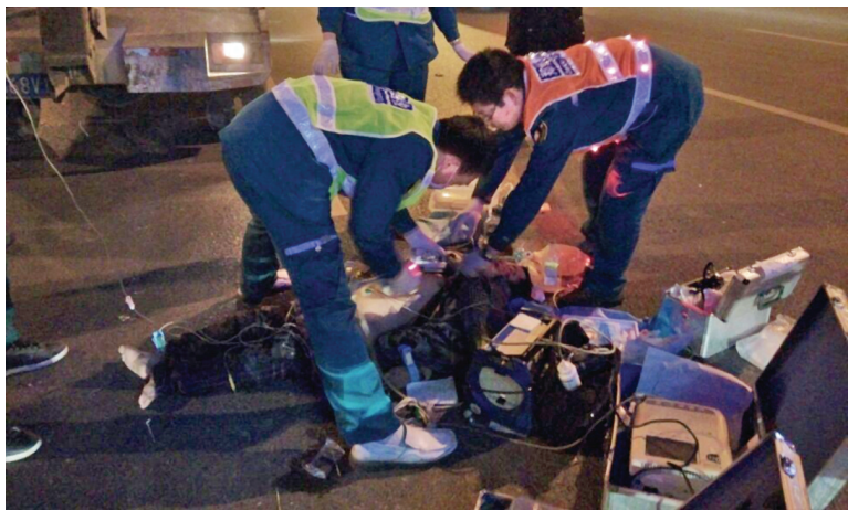
急救人员正在全力抢救被撞男子。

2月27日晚,一名男子由东向西横穿中州大道时,被一辆面包车撞倒,急救人员抢救半个多小时,依然未能挽回其生命。