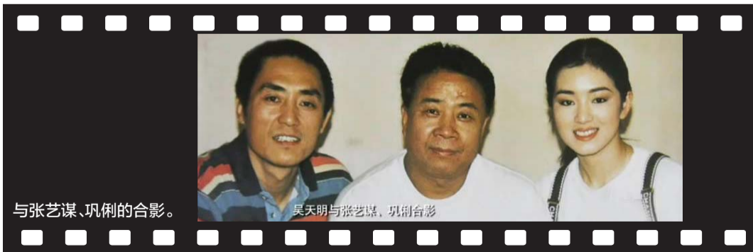
与张艺谋、巩俐的合影。