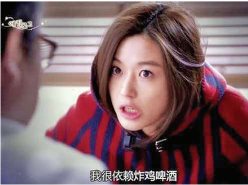
我很依赖炸鸡啤酒