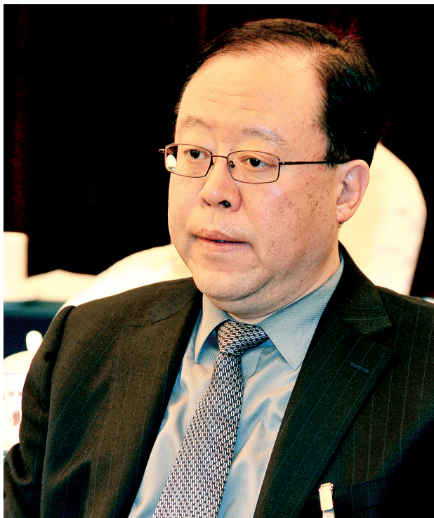
马懿: 郑州进一步发挥优势,提升大枢纽地位

马懿说,郑州最大的优势就是区位和交通优势,打造现代综合交通枢纽、形成现代物流中心,是今后发展的关键和命脉。借助这个优势,河南省委、省政府积极谋划郑州航空港经济综合实验区,并于去年3月7日得到国务院正式批复,实验区上升为国家战略。省委、省政府把实验区建设作为全省的“一号工程”,要求郑州进一步发挥区位优势,提升综合交通优势,巩固提升大枢纽地位,带动大产业、大都市,从而形成区域经济发展极,把实验区建成河南乃至中原地区开放的平台和窗口。