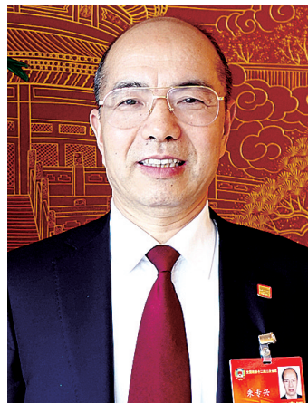
朱专兴 全国政协委员、民盟河南省委副主委