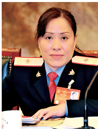
邹慧 全国人大代表