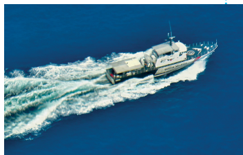
中国海警3411船抵达疑似失联海域

8日10时30分,交通运输部部长杨传堂在中国海上搜救中心组织召开紧急会议,宣布立即启动一级应急响应,成立马航失联客机应急响应领导小组,下设协调联络组、应急机动组、服务保障组、信息宣传组,立即开展各项应急工作。中国海上搜救中心与越南国家搜救中心通过电话、邮件沟通联系,并部署南海救助局、广州打捞局,广东、海南海事局14艘专业救助船和6艘海事执法船及2架巡航救助飞机做好应急出动准备。