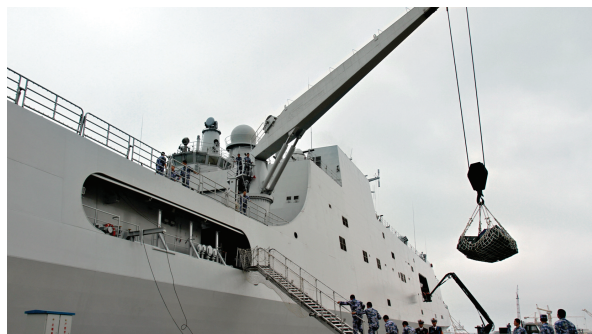
井冈山舰在吊运装载救援物资。

中国海警3411船于3月9日13时30分抵达马航客机疑似失联海域中心位置,截至19时,在搜救范围内航行60海里,搜索面积约200平方公里,尚未发现可疑目标。