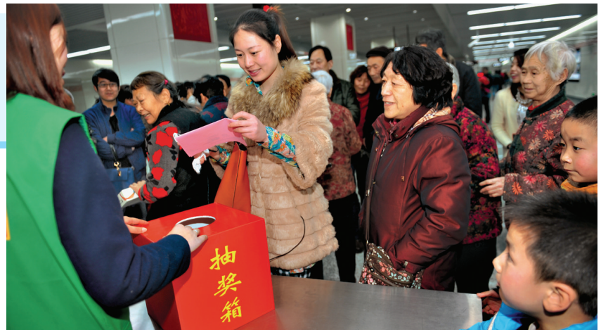
人人都希望自己能抽中大奖。

为庆祝妇女节,为女性同胞提供更多关爱和福利,郑州地铁和《中原地铁报》强强联合,特别推出“地铁梧桐引凤来,相约三月送祝福”妇女节送礼活动。3月8日吸引了众多女性乘坐地铁参与本次活动。活动现场热闹非凡,更有女乘客提早半小时就来到站点等候。