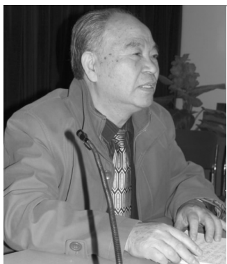
胡维勤教授谈“吃菜养心”疗法: 绿色安全,简单实用

作为普通老百姓,都想知道高层人士日常保健方式和治疗疾病的办法,近日,北京特级保健医师胡维勤教授,根据多年来多位高层人士的食疗菜谱,向广大心脑血管病患者推荐“吃菜养心”的实用疗法,实现少吃药、不吃药防治心脑血管的愿望。目前,这一疗法由北京康泰中医中药研究院开始在全国普及推广。