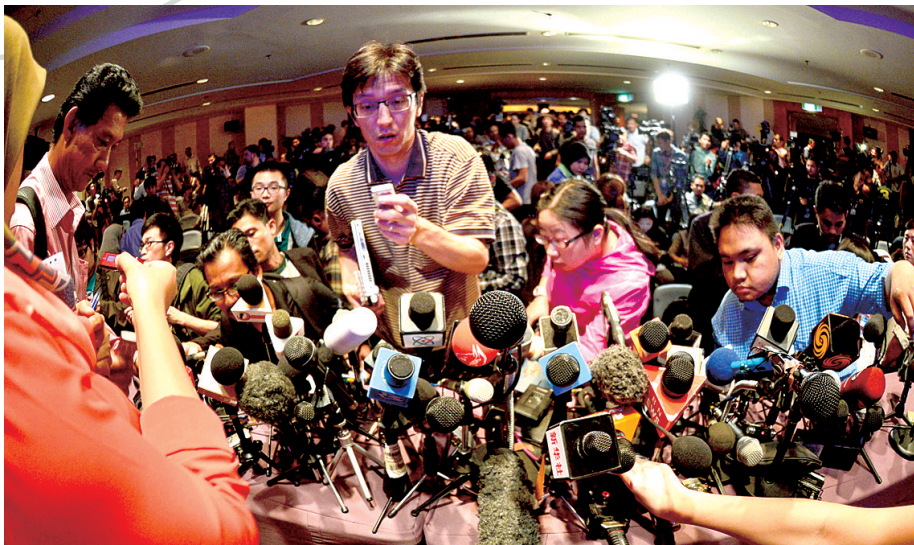
3月10日,在马来西亚吉隆坡,全球媒体聚焦马航客机失联事件