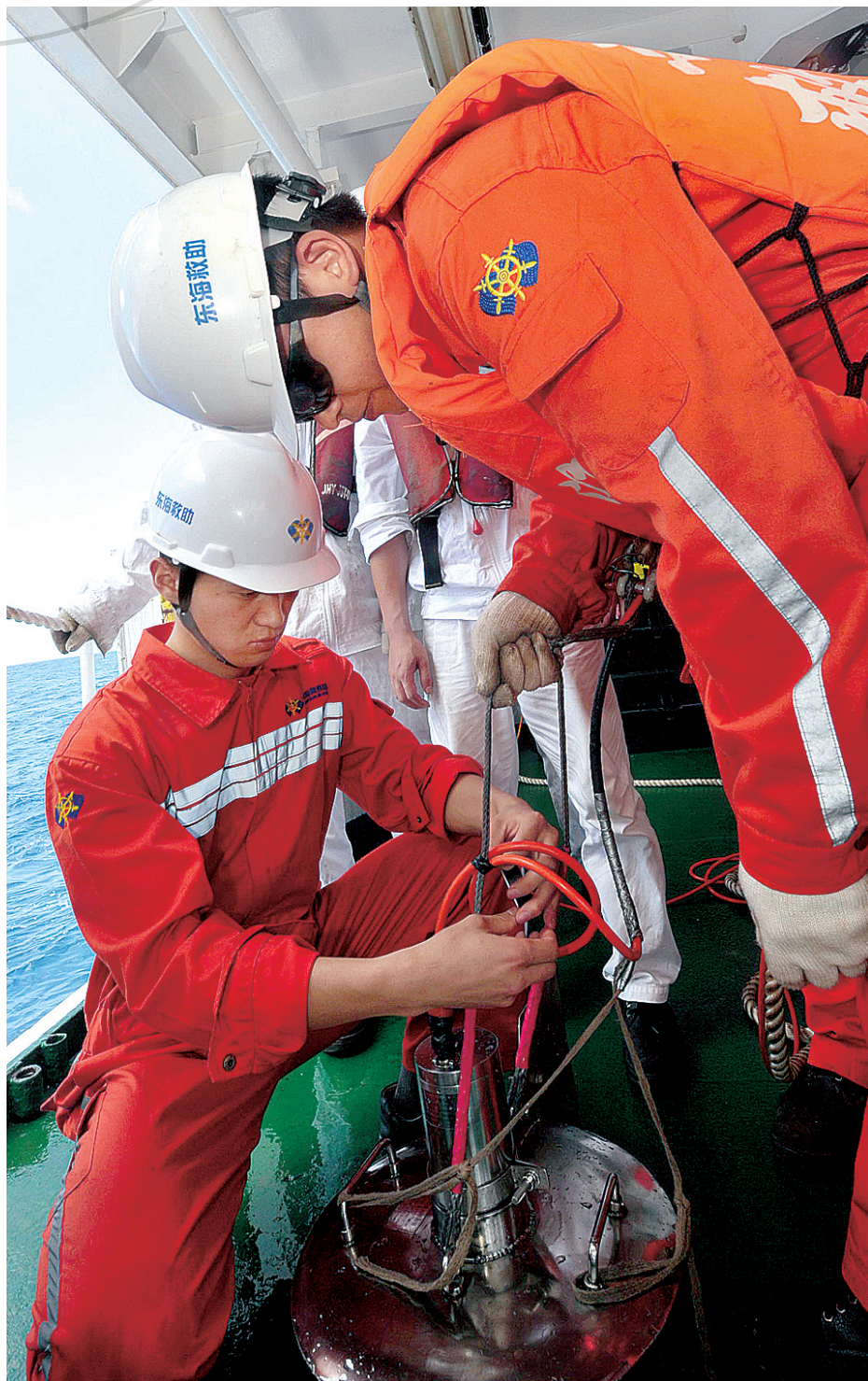
3月12日,搜救队员在“南海救101”船上调试水下声呐系统,扫测疑似海域。