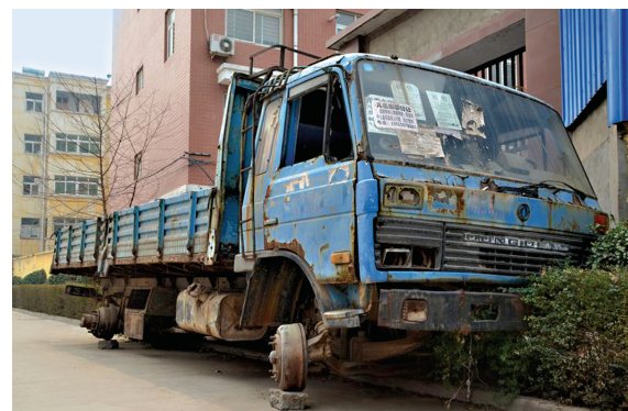
“广告” 中牟县水岸鑫城小区门口废弃的卡车上贴满了广告。邢昊冉 摄