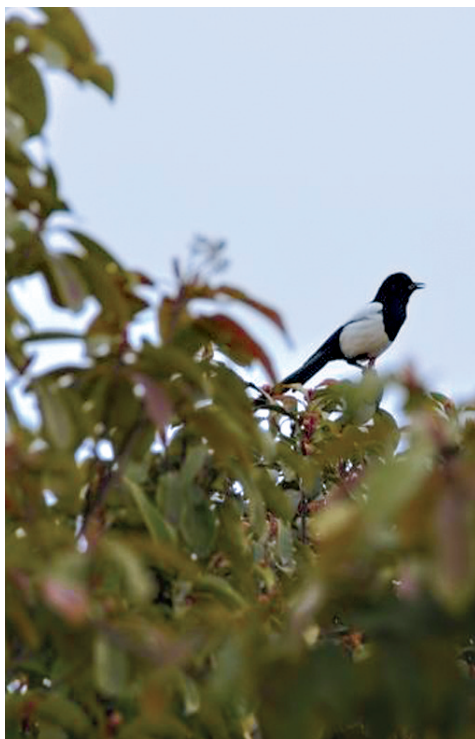
鸣春 中牟县四牟园内,一只喜鹊在枝头欢快地鸣叫。

人生是一道风景,快乐是一种心境,春观桃花夏看柳,秋赏黄菊冬寻梅。月圆是诗,月缺是画,日上灿烂,日落浪漫,天仪再始,岁律更新。春暖花开,草长莺飞,在这个充满生机的季节,郑州晚报·中牟播报记者分赴中牟城镇、乡村、商店、集市……用镜头拍下一张张充满喜庆、洋溢着生活气息的照片。春到中牟,朝气蓬勃;春在中牟,诗意盎然。