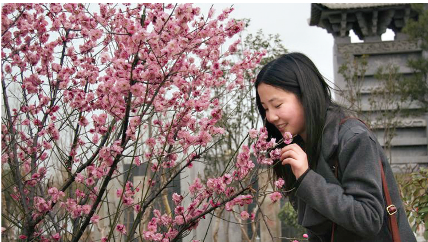
嗅春 中牟县绿博园内,一名少女轻嗅桃花。

人生是一道风景,快乐是一种心境,春观桃花夏看柳,秋赏黄菊冬寻梅。月圆是诗,月缺是画,日上灿烂,日落浪漫,天仪再始,岁律更新。春暖花开,草长莺飞,在这个充满生机的季节,郑州晚报·中牟播报记者分赴中牟城镇、乡村、商店、集市……用镜头拍下一张张充满喜庆、洋溢着生活气息的照片。春到中牟,朝气蓬勃;春在中牟,诗意盎然。