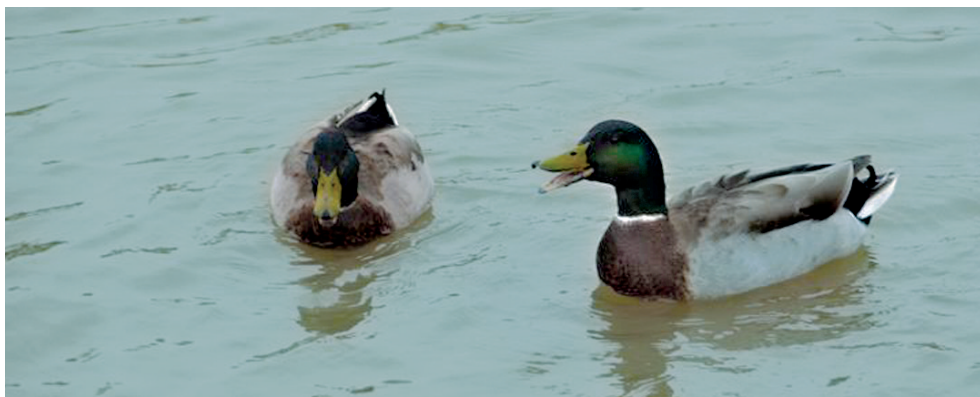
探春 春江水暖鸭先知。中牟县翠鸣湖内,两只野鸭悠闲地游弋。李雪平 摄