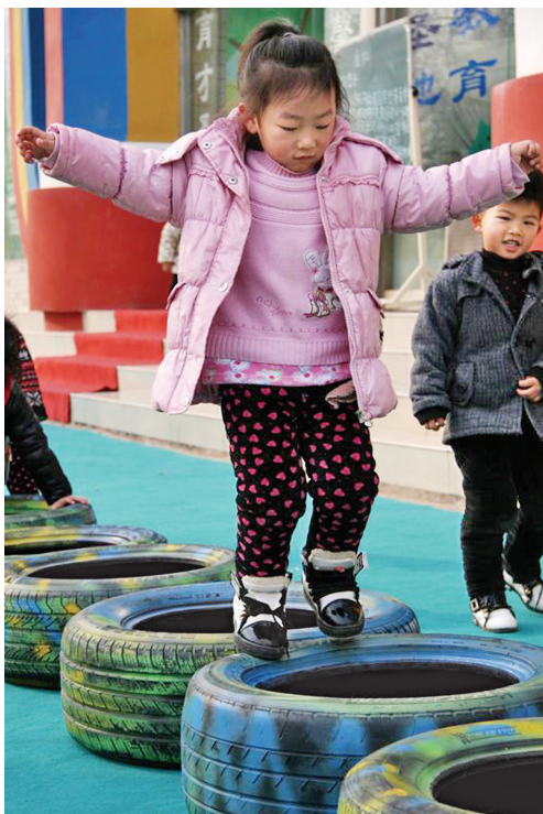
平衡 中牟县启程幼儿园内,小女孩在户外课上走轮胎锻炼平衡力。