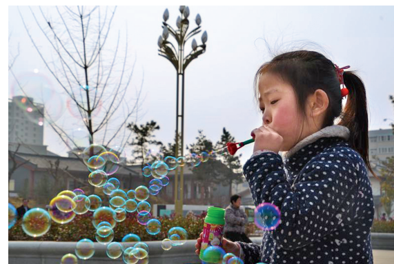
缤纷 中牟县潘安公园内,小女孩吹出五彩缤纷的泡泡。