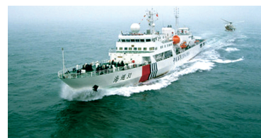
“海巡31”轮开往马六甲