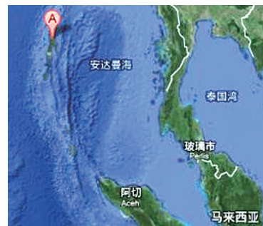
美官员称飞机可能飞向印度洋

美联社说,波音公司提供一项卫星连接服务,让飞机可以及时向卫星发送数据,显示飞机的运行状态。航空运营商可自行决定是否购买数据传输服务,马航没有注册这项服务。