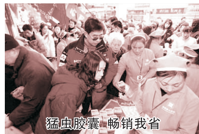
猛虫胶囊 畅销我省

在河南的哮喘患者心中，猛虫胶囊就是他们的大救星。从来就没有一个产品能像猛虫胶囊一样，一吃下去5分钟迅速止咳平喘，当天就能恢复畅快呼吸。