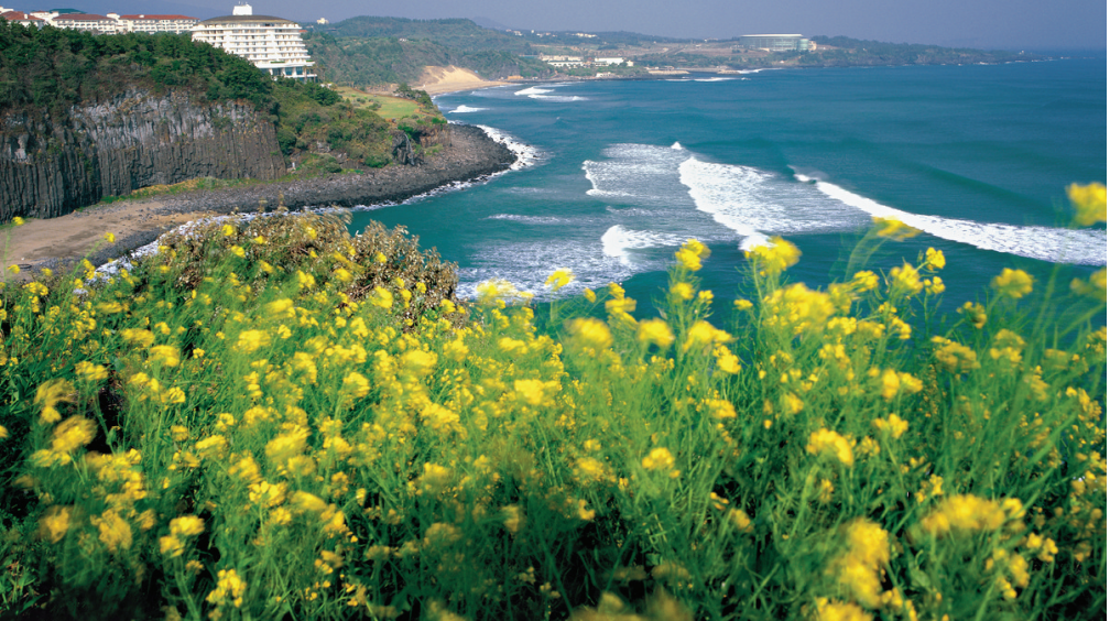
韩国济州岛