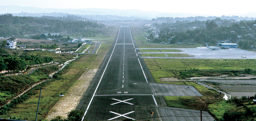
这是3月18日在印度安达曼群岛和尼科巴群岛中央直辖区首府布莱尔港拍摄的布莱尔港机场。

马来西亚内政部长艾哈迈德·扎希德·哈米迪19日说,调查发现马航失联航班机长家中飞行模拟器一些近期数据已被删除,马方正组织力量努力恢复,以期解开飞机失联谜团找到一些线索。马来西亚代理交通部长希沙姆丁·侯赛因19日说,马来西亚将派一个高级别工作组前往北京,处理失联的马航MH370航班有关事宜。工作组由总理署、外交部、空军和马航等相关部门人员组成。