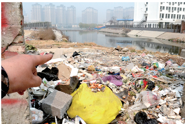
金水河长江路桥下河水发臭,河边堆放众多垃圾