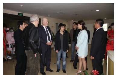
美国生殖医学技术专家一行参观郑州圣玛妇产医院

发布会上,来自河南电视台都市频道、民生频道、郑州电视台、大河报、河南商报、大河健康网等媒体人共同见证了这一突破性的时刻,随后的笔者走访时,双方均表示,此次共同推进试管婴儿在豫项目合作意义重大,对双方都是一次成功的尝试。