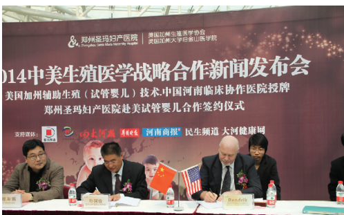
签署中美生殖医学战略合作协议