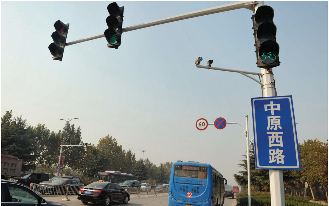
西区有山有水，自然与文化生态相较郑州其他区位均有优势。

谈及择址此区域的原因，五洲城项目负责人表示，西区有山有水，自然与文化生态相较郑州其他区位均有优势。而且国家与郑州市的大型水利建设将在郑州西部形成水系生态景观，物流交通的完善等因素，将使得这里更有条件获得发展机遇，区域产品价值将一路攀升。