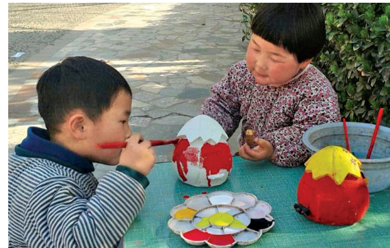
朋友 中牟县新世纪广场内，小孩儿画完自己的作品后认真帮助小伙伴。