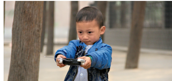
专注 中牟县烈士陵园内，一个小孩儿聚精会神地玩着遥控赛车。