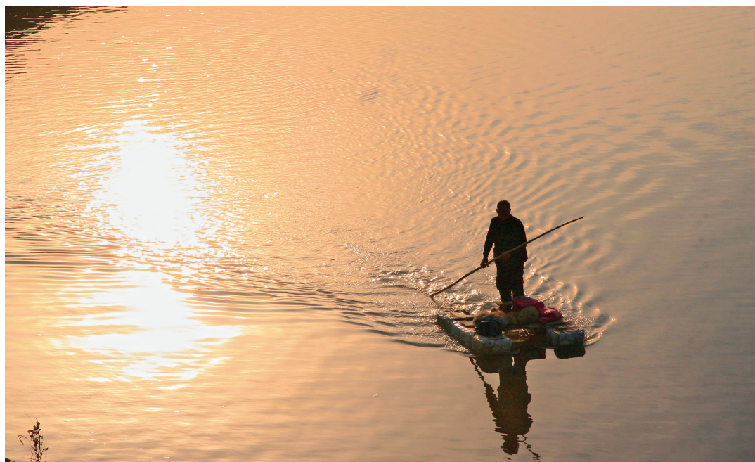
渔舟 中牟县雁鸣湖镇黄河段，一位老人映着落日的余晖划船回家。

你可在微博上@郑州晚报，或发邮件到zzwbzmjb@163.com，也可加入本报的QQ群143531052，以【我爱拍拍】+自拟标题发帖即可参与。照片请注明拍摄地点，并留下您的姓名和联系方式。