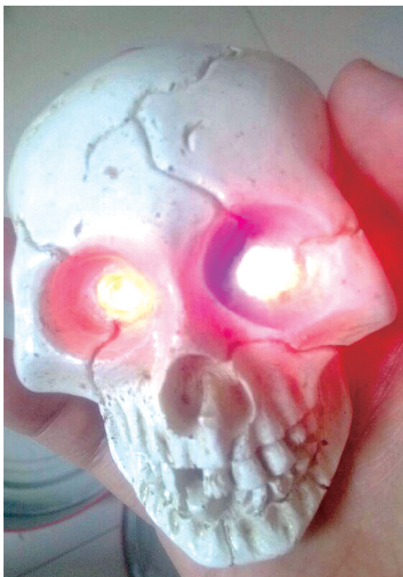
能发光能发声的骷髅玩具

侄子从学校门口购买的骷髅玩具,不但能发出“滋滋”的声音,眼睛还能闪出红绿色的光,这让看到的成年网友“这个哥不太冷”也觉得吓人。