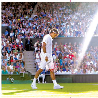
2008年,费德勒在温网男单第二轮。