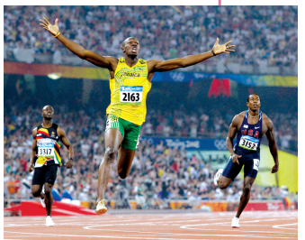
2008年北京奥运会上,博尔特在200米决赛中冲刺。

小编:多年不看书,整日锅碗瓢盆、柴米油盐、电脑手机,那天刷到有人说“记得王小波的名言:参差多态乃幸福之本源”,还是忍不住想吐槽一下,在这个一通转载的年代,罗素的话虽然被王小波多次引用,最后就干脆安在王小波身上了?