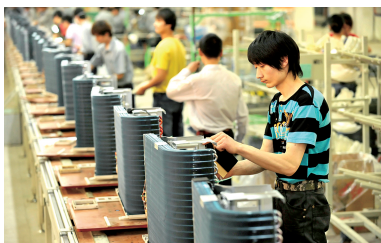
格力电器郑州产业园