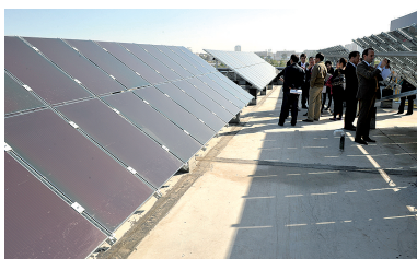
河南君阳电力 350KW 非晶硅太阳能屋顶电站