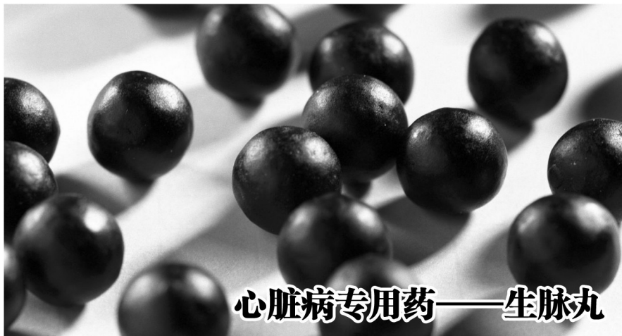
心脏病专用药——生脉丸

在大会现场，有几位与会专家也是心脏病患者。他们摩拳擦掌，跃跃欲试。谭门生脉丸一吃，只感到一股暖流顺着嗓子直往胸口里钻，5分钟不到，胸闷、气短、惊慌就迅速缓解，浑身就象充满电，老专家们连呼神奇！