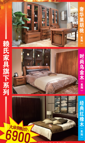
工厂倒贴价大床型号: A8B0218床头+A8U0118-A床箱

中博名店街赖氏家具总店 居然之家四楼胡桃大师店 居然之家四楼乌金名作店 居然之家四楼红橡至尊店 欧凯龙东区三楼乌金名作店