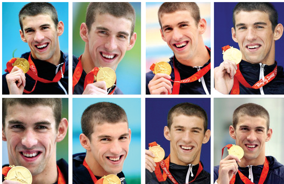
菲尔普斯北京奥运会勇夺八金

有意思的是，昨日，美国第一位连续5次参加奥运会游泳比赛的托雷斯透露了一则小故事——2012年伦敦奥运会后，菲尔普斯宣布退役，并表示暂无复出打算。当时托雷斯在推特上写道：谁愿意赌菲尔普斯复出再战2016年里约奥运会？菲尔普斯回复她：我愿意。陶邢莹