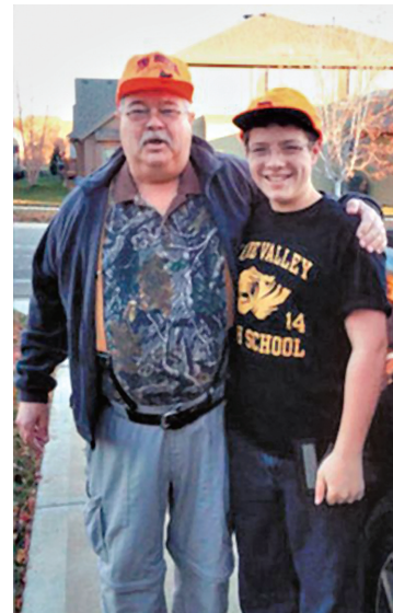
被枪杀的祖孙二人。