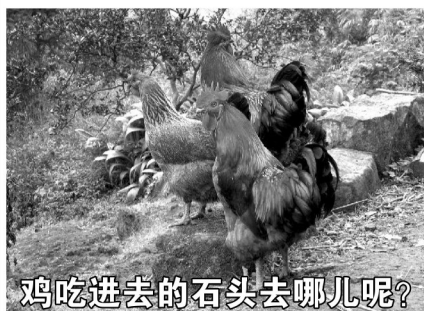
鸡吃进去的石头去哪儿呢?

最近,中医结石病防治中心,公布了一项研究结果:家禽鸡体内的砂囊内壁(简称鸡内金),能研磨石头并完全消食,而用鸡内金与绿茶、淡竹叶、甘草、小蓟、金银花、茯苓、桃仁、枸杞子泡茶喝,不仅能迅速化掉人体内的各种结石,还能疏肝胆、强肾脾。