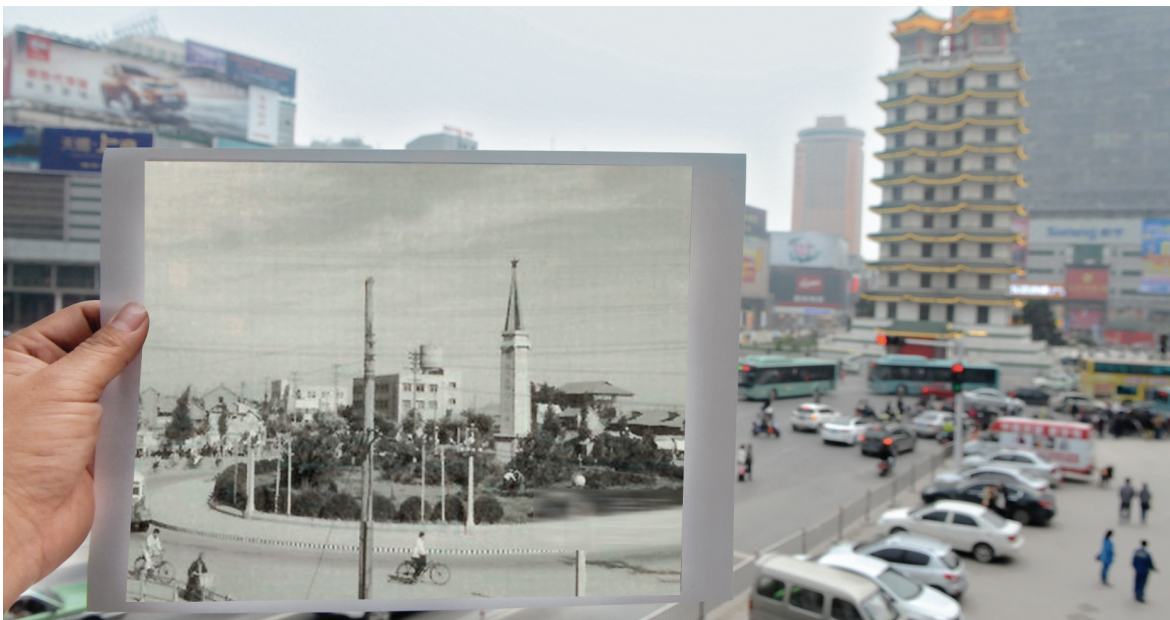
上世纪 60 年代的二七广场附近,与现在对比,岁月变迁,二七广场变成时尚漂亮的繁华商业区。