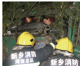
第二起事故中的伤者

昨日凌晨，在新乡卫辉市后河镇的新濮路上，一辆货车撞上路边大树后，紧接着，另一辆货车也撞上了路边大树，均是车头严重变形，均是受伤的司机被困其中。消防官兵连夜赶赴现场将司机救出。