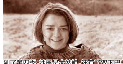
到了第四季,她已是大姑娘,还有了双下巴!