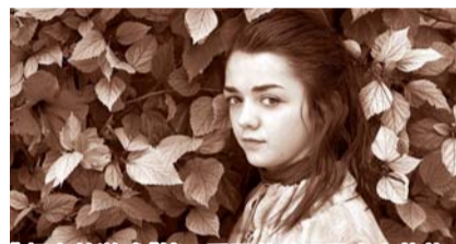
《权力的游戏》第一季里艾莉亚是个小萝莉。

< 生日当天,“赫敏”在片场拍戏。 > “艾莉亚”忙着为《权力的游戏》第四季造势。