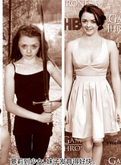
萝莉到少女,妹子发育得好快。