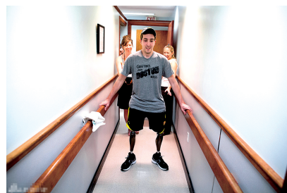
第一次用假肢行走