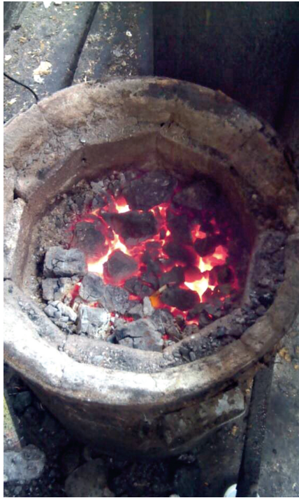
屋里煤炉还在燃烧着

昨日早上6点,在杜岭街张砦南街,一对来自开封杞县的夫妇因煤气中毒意外死亡在出租的房屋内,11点46分,亡者亲人将其拉回老家安葬。 线索提供 范洁(稿费50元)