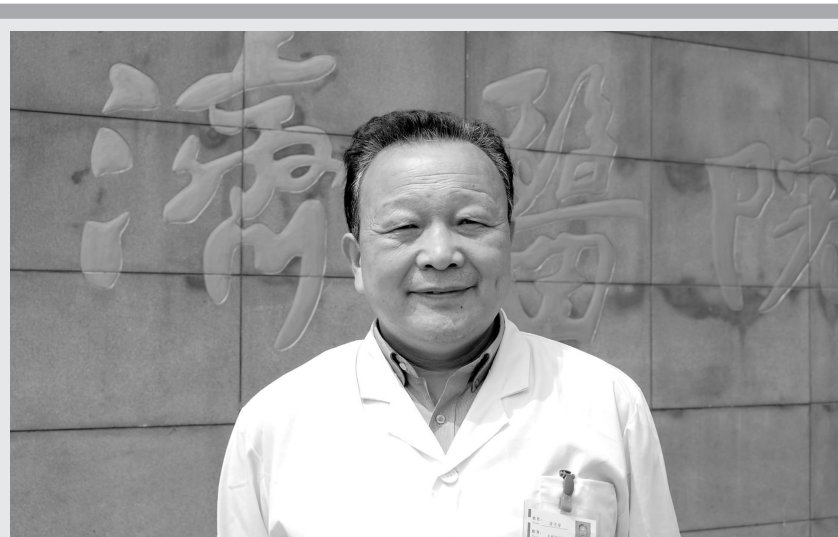
“耳病救星”——霍显成教授