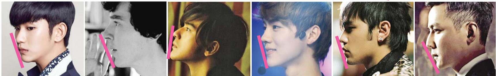
再来点负能量吧。都敏俊xi、卷福、金城武、鹿晗、周杰伦和吴彦祖(从左到右)也是能成功通过鉴别的大!美!人!(卷福混在里面怎么这么怪呢……)

近日,一款“日本美丑鉴别法”悄然流行于网络,包括张歆艺、韩雪在内的圈内网友纷纷把食指搭在了鼻、口、下巴处,做出“嘘”的动作,只有鼻子和下巴碰到食指的人才是美人,若是三点一线,嘴也碰到了食指,那非常遗憾,你是丑人。这个鉴别方法科学吗?整形博士修志夫有话说:“只要鼻尖高度理想、下巴突度足够,达到这个‘美丑鉴别标准’并不难。”眼尖的网友也发现,凸鼻子的孙猴子、二师兄,以及“猪腰子脸”的赵本山、马云、成龙和周华健都达到这个标准,而那些垫了鼻子和下巴的明星轻而易举就能做到。所以,这个逗比方法算什么,记者为你搜罗了两个更科学的测量办法,简单易行,快去拿尺! 南都供稿