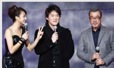
曹颖:现场报名享受特别优惠,只要加一个手指,就能鉴别两位美男! 周华健、李宗盛:……(均为设计台词)