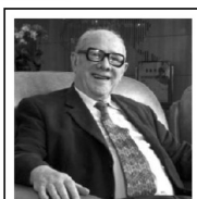
世界超声医学之父——法兰克福博士

1995年3月,德国“UHD计划”(超声医学心脏探索计划)在法兰克福生命研究中心秘密展开。18年后,德国联邦卫生部向全球医学界发表公开声明:因为一种尖端科学技术的成功介入,非药物、非手术溶解血栓、软化心血管、提高血管弹性、降低血脂已经成为医学现实。