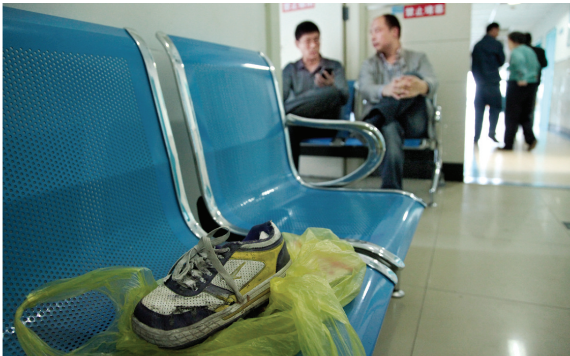
手术室外,孩子的鞋放在长凳上。

妈妈在家中做好午饭等儿子放学,左等右等不见踪影。沿着儿子回家的路线一路找寻,在十字路口围观的人群中,她发现孩子腿部血肉模糊,昏迷在斑马线旁。 郑州晚报首席记者 徐富盈 郑州晚报记者 刘凌智 实习生 赵龙翔 文/图