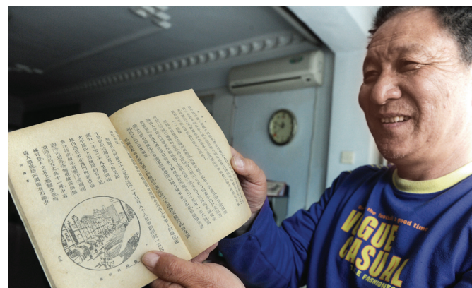
1934年的小学课本上有对郑县的描述。

在书的背面，还写有“四三三册”字样。李仲楷说，这是多年前他从旧书摊上花100块钱买的，现在花多少钱也不一定买得到。