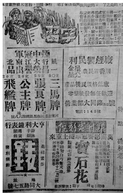
上世纪50年代的广告

本市目前最高的建筑物——河南省医学院病房大楼,已于最近竣工。这座楼房高七层,共有建筑面积一万七千二百七十六平方公尺。在它的旁边,还有一座高五层的门诊大楼也同时竣工。明年下半年开诊后,这里每天可以容纳一千人门诊,比省人民医院的门诊人数还多一倍。