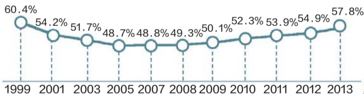
图书阅读率的历年数据(部分年份数据缺失)