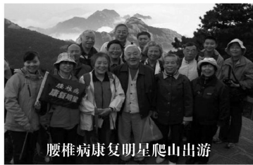
腰椎病康复明星爬山出游