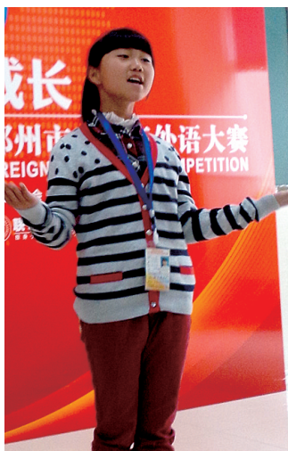
选手在外语比赛现场

小学高年级组的一个选手,在清晰的发音、流畅的演讲中,还巧妙地配合了舞蹈和唱歌等。这些恰到好处的肢体语言,让她显得很有演讲家的“范儿”,为其演讲增色不少。还有一个高中组的男同学,结合自己的演讲内容,特别私人定制了一个“专属T恤”,形象生动,极具创意性。