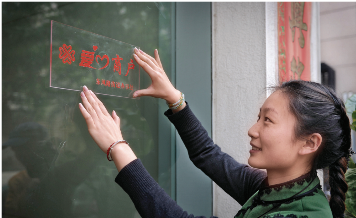
今后,天明路上的爱心商户有了统一的“爱心牌”。