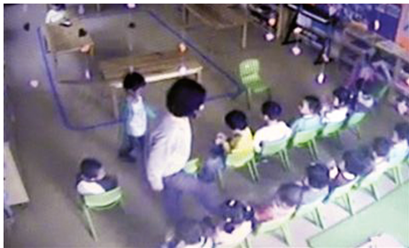
监控视频显示，女老师用脚踢孩子