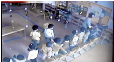
该老师用手推小孩